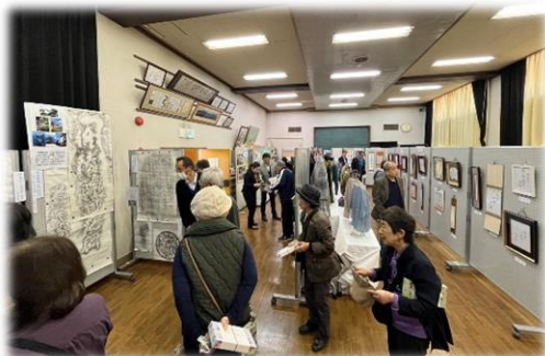
展示の部 柳本公民館 会場