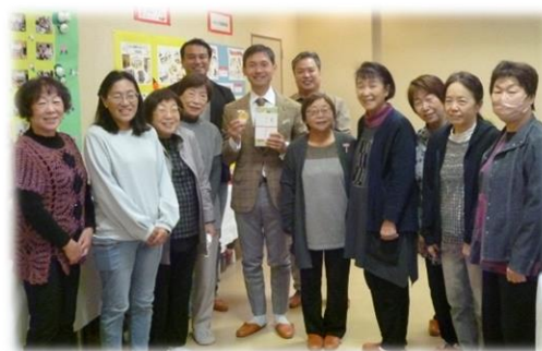
展示の部 式上公民館 会場

「展示の部」の会場は、柳本公民館会場と式上公民館会場の2か所にて、それぞれの活動拠点での発表を行いました。日頃の活動の成果を展示発表し、レベルの高い作品が並んだ会場では、多くの来場者が時間をかけて作品を鑑賞されていました。今年は、柳本公民館で活動しておられる料理サークルが日頃の活動の一環として両会場で、手作りのチョコソフトルッキーを来場者に、式上公民館会場では、昨年引き続き「フラワーアレンジメント教室」、「編物教室」、「折り紙教室」のワークショップをと、それぞれの会場で盛り上がりました。