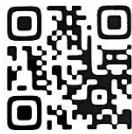
フードバンク天理